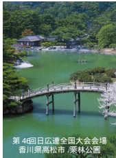
第4回日広連全国大会会場 香川県高松市/栗林公園

議案 報告事項・第1号議案 業務報告について 審議事項・第2号議案 第4回通常総会提出案件及び運営について 第3号議案 第4回全国大会の日程及び運営について 第4号議案 全国代表者会議の開催について 第5号議案 常任委員会規約の一部変更について 第6号議案 慶弔規程の一部変更について 其他議案